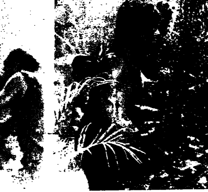
مناظرة السجناء الاميركيين